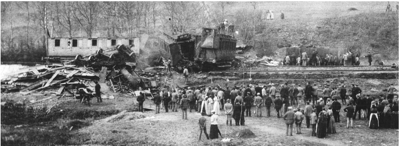
Historisches Foto: Sammlung Thea Merkelbach (Ausschnitt)