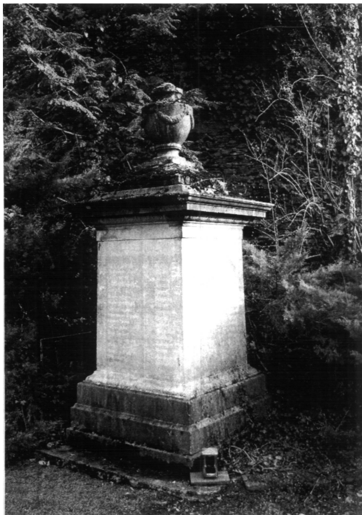
Kriegerdenkmal auf dem Friedhof in Cochem 9

In Cochem ist sein Name auf einem Kriegerdenkmal aus dem Jahre 1879 zu finden. Dieses Denkmal wurde vom Kreis Cochem zum Gedächtnis der Gefallenen der „glorreichen“ Kriege 1864, 1866 und 1870-71 stand in der Moselallee in Cochem. Auf dem Sockel war es, mit einer von dem Geheimrat Louis Ravené 6 gestifteten riesigen Bronzefigur, der Germania, verziert. Nachdem diese ihre Standfestigkeit verloren hatte wurde sie durch die heutige darauf befindliche Urne ersetzt.