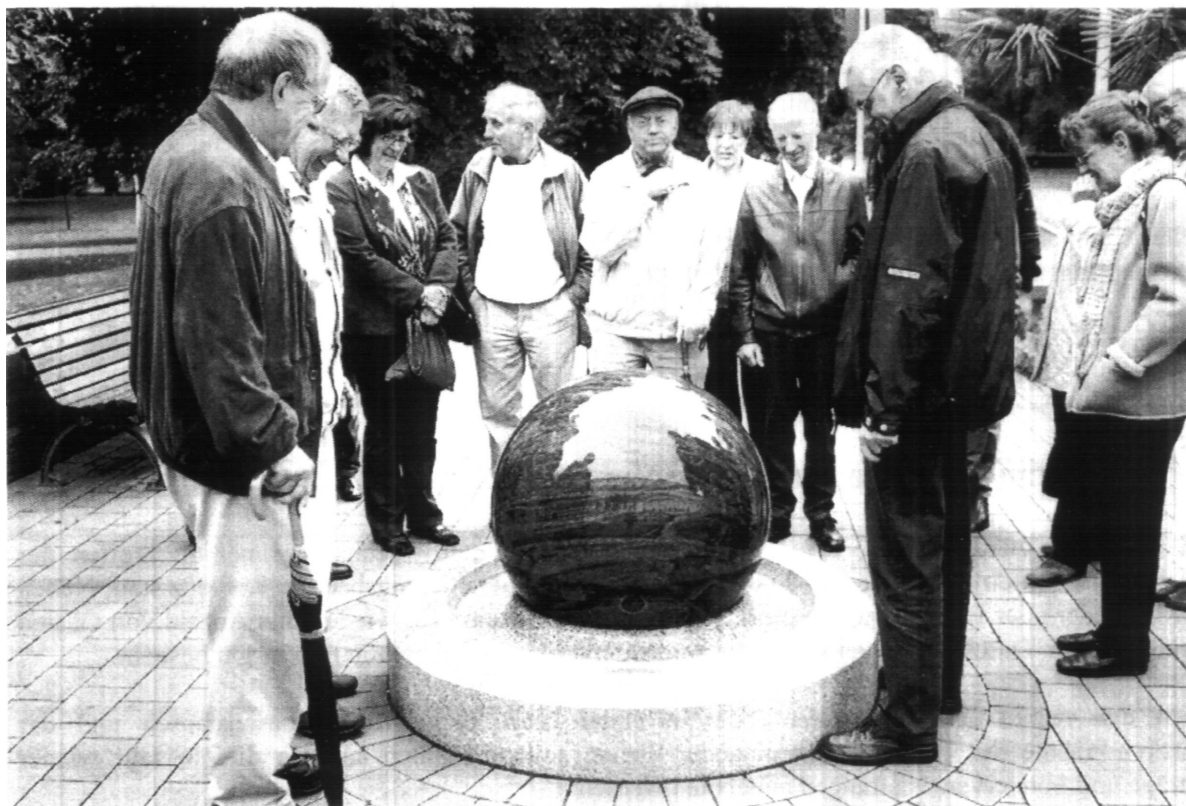
Die Gruppe in Bad Ems